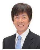
高田 明 株式会社A and Live 代表取締役 株式会社ジャパネットたかた 創業者