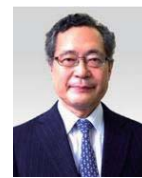
長澤 泰 東京大学 名誉教授