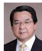
岡野 光夫 東京女子医科大学 先端生命医科学研究所 特任教授