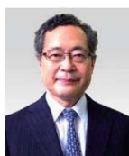
長澤 泰 東京大学 名誉教授