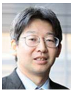
清水 達也 東京女子医科大学 先端生命医科学研究所 所長・教授