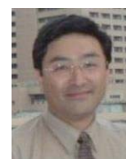
村松 正明 東京医科歯科大学 分子疫学研究室 教授