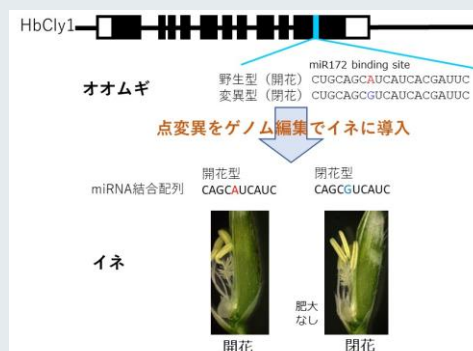
比較ゲノム+ゲノム編集による開花性作物の作出事例

本講演では、精密かつ効率的なゲノム編集を可能にするゲノム編集ツール開発の、現状と展望について解説するとともに、新規ツールの活用例について紹介したい。