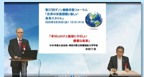
※昨年度のライブ配信の様子