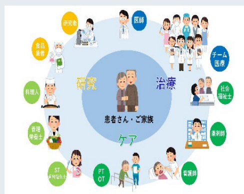
嚥下を取り巻く環境

※ 食べ物を認識して、口腔、咽頭、食道を経て胃に送り込むまでの一連の動作に障害があること