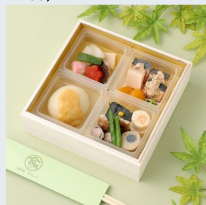
やわらか京料理：見た目・味そのままにプリンの柔らかさ

和食という文化を、嚥下食という形に変えて生涯伝えられることを、経験を踏まえて事例紹介します。