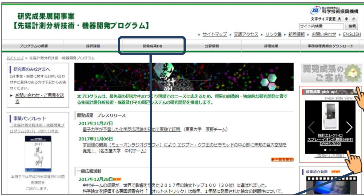
先端計測 開発成果 DB (データベース)

詳しくは 先端計測のウェブサイト https://www.jst.go.jp/sentan/ をご参照ください。